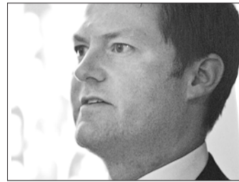
JEFF GEORGE (CEO de Sandoz). La diffusion des génériques stagne à un niveau modeste en Suisse.

Lors de la présentation de ses chiffres, hier, Sandoz Suisse a relevé que la progression du marché suisse des médicaments génériques avait connu un fort ralentissement, après des taux de croissance supérieurs à 40% en 2005 et 2006. En comparaison internationale, la diffusion des génériques stagne à un niveau qualifié de modeste sur le marché domestique. En Suisse, la demande représente 11 à 12% du marché des médicaments. Très loin de certains débouchés matures, comme les Etats-Unis, où le taux de remplacement atteint près de 70%. Reflet des politiques d'incitation.